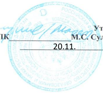
ГРАФИК ЗАЩИТЫ КУРСОВЫХ РАБОТ ПО СЕЦИАЛЬНОСТЯМ:

44.02.02 Преподавание в начальных классах